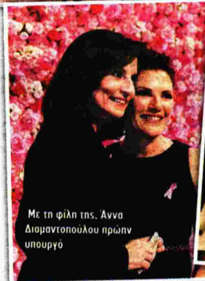
Με τη φίλη της, Άννα Διαμαντοπούλου πρώην υπουργό