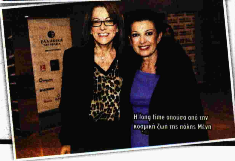
Η long time απουσα από την κοσμική ζωή της πόλης Μένη